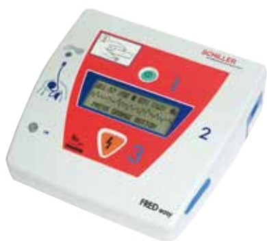
FRED EASY CON ESCLUSIONE MANUALE