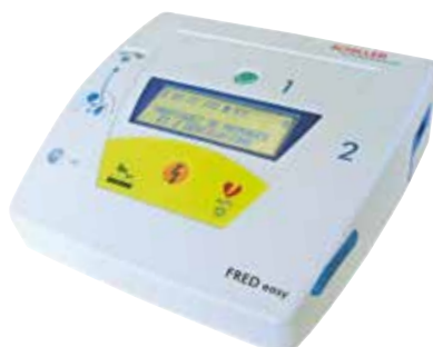
FRED EASY COMPLETAMENTE AUTOMATICO